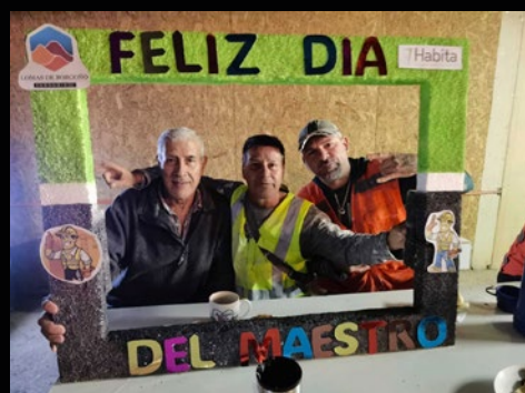
Obra Lomas del Sauce.