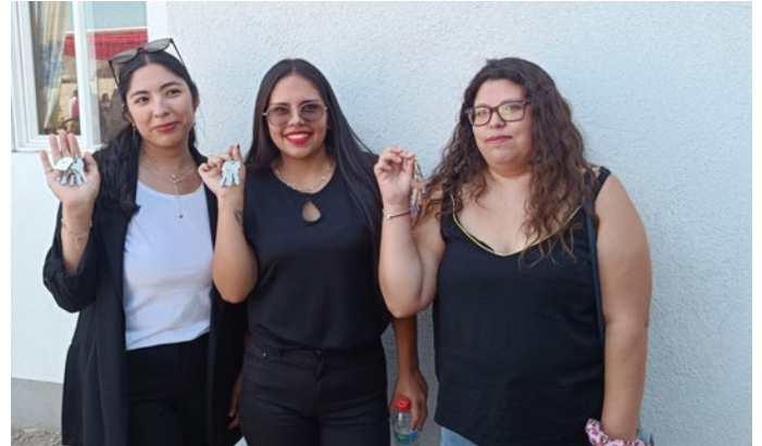
Beneficiarias del plan de emergencia habitacional, Condominio Punta Negra II.

Este momento marcó el inicio de una nueva etapa para estas familias, quienes ahora tienen la oportunidad de construir un futuro en un ambiente seguro y confortable.