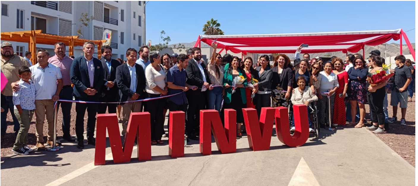
Beneficiarios y autoridades haciendo apertura del proyecto en ceremonia de entrega de llaves.