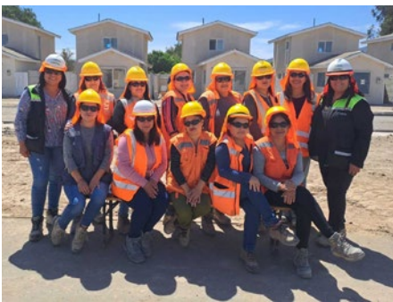
obra Viñedos del Liimari