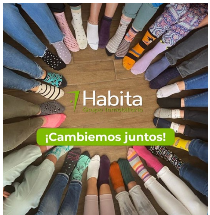
Iniciativa de cambio de calcetines en oficina central

Nos enorgullece compartir el recibimiento positivo que se generó en el Día Internacional del Síndrome de Down, al cual invitamos a participar activamente con la iniciativa de cambiar los calcetines, acto que simboliza el abrazo a la diversidad y a nuestras únicas diferencias.