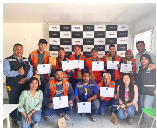
Maestros certificados junto a expositor y jefaturas.

Los maestros de post-venta culminaron con éxito la capacitación en “Electricidad y Obras Sanitarias”, participando en talleres prácticos donde adquirieron habilidades en el reconocimiento de herramientas, su uso y conocieron de cerca la normativa eléctrica. Tras realizar la última evaluación, han obtenido la certificación. Este logro no solo refleja su dedicación, sino también su compromiso de brindar un servicio excepcional a nuestros clientes.