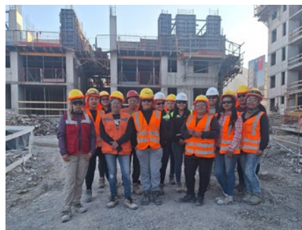
Obra Carmen Vilches