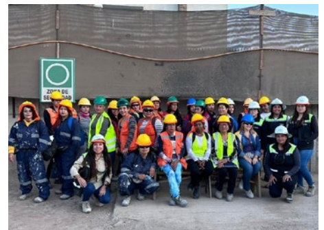
Obra Lomas de Borgoño