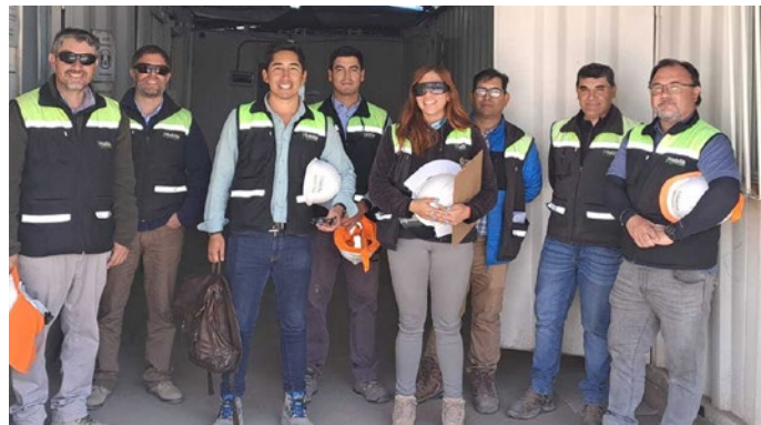
Visita de obra Reserva del Limari a obra Viñedos del Limari

Continuamos con las exitosas “Visitas Cruzadas” entre las obras, con el fin de fortalecer e intercambiar valiosas experiencias, los administradores de cada proyecto se unen para identificar oportunidades de mejora a nuestras condiciones de seguridad y optimizar procesos productivos.