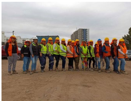
Obra Pacific Blue