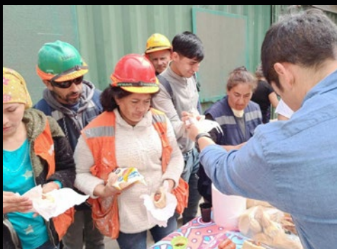
Obra Pacific Blue.

En obras y oficina central compartimos y conmemoramos a nuestros trabajadores en el día del maestro obrero constructor. Felicitamos a todos aquellos que se esfuerzan día a día por construir un futuro sólido para nuestras comunidades.