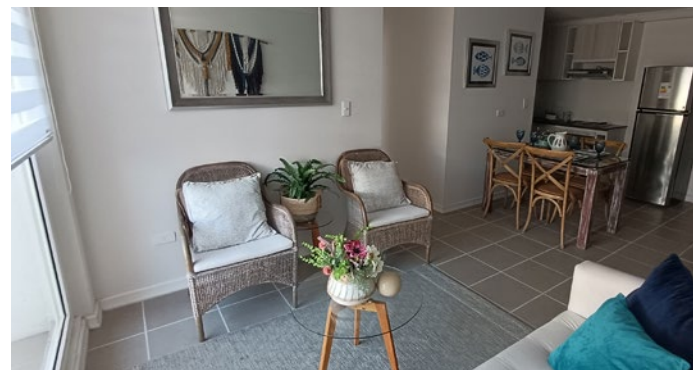
Living comedor, piloto de Pacific Blue

Durante el mes de marzo se inauguró nuestros nuevos pilotos del proyecto "Pacific Blue", en la ciudad de La Serena. Con un avance del 64% el proyecto se encuentra cercano a la etapa final para entregar a los clientes su futuro hogar.