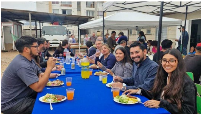
Celebración de cumpleaños mes de marzo.

Durante los meses de febrero y marzo nos unimos para celebrar a nuestros compañeros que cumplen un año más de vida. Esta iniciativa no sólo nos da alegría, sino que también fortalece nuestros lazos y creamos un ambiente laboral más unido.