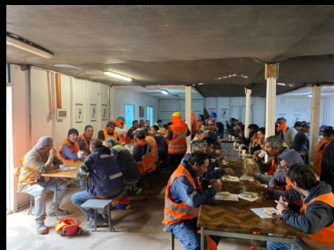
Obra Viñedos del Limari.