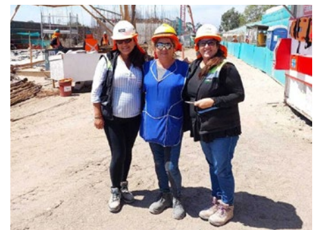
Obra Aires del Sauce