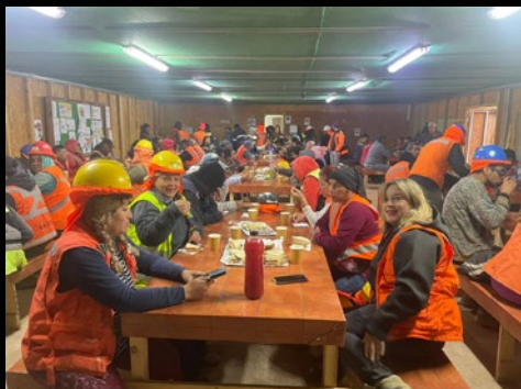
Obra Faldeos III.