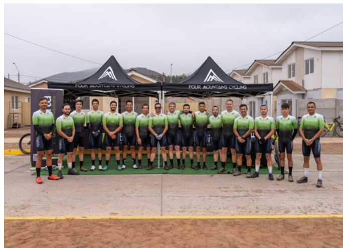
Equipo Four Mountains en lanzamiento de patrocinio.

Este evento destacó la importancia del deporte, la salud y el bienestar, subrayando el compromiso de Habita con la creación de comunidades activas y saludables.