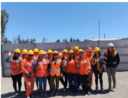
Obra Aires del Limarí