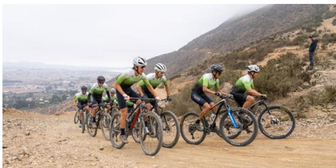
Equipo de four mountains sube el cerro grande