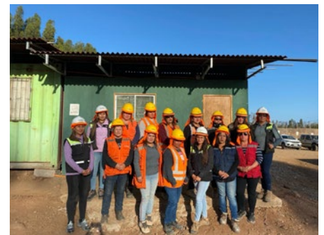
Obra Faldeos III